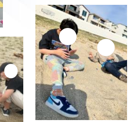
お天気のいい日には公園や海岸 にお散歩に出かけています。