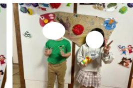
制作活動を頑張っています。 素敵な作品がいっぱいです。