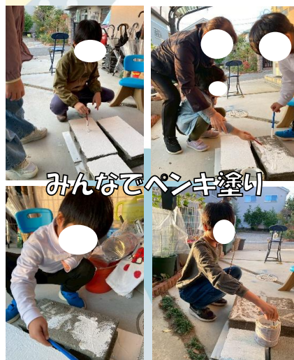
みんなでペンキ塗り